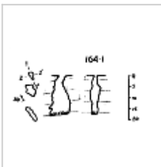
164-1 План и разрез