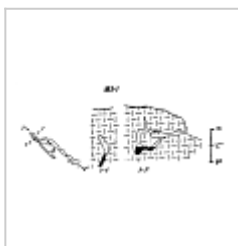
183-1 План и разрез