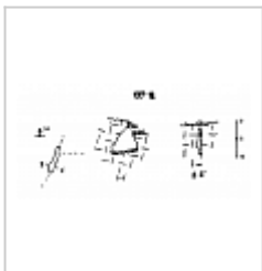
197-18 План и разрез