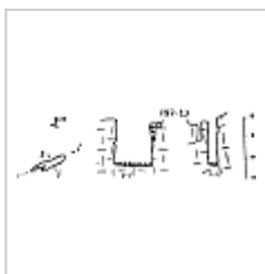
197-23 План и разрез