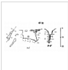
197-24 План и разрез