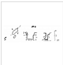
197-3 План и разрезы