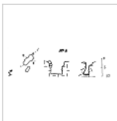
197-3 План и разрезы