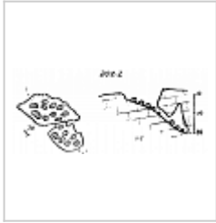
202-2 План и разрез