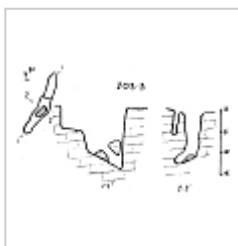
203-3 План и разрезы