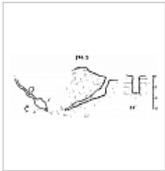
244-3 План и разрезы