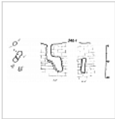
246-1 План и разрез