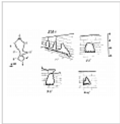
252-1 План и разрезы