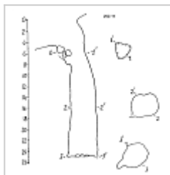
252-11 План и разрез