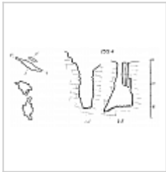
253-4 План и разрезы