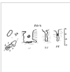
253-5 План и разрез