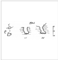
254-2 План и разрезы