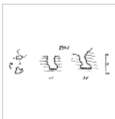
254-2 План и разрезы