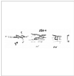
254-4 План и разрез