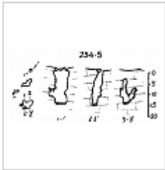
254-5 План и разрез