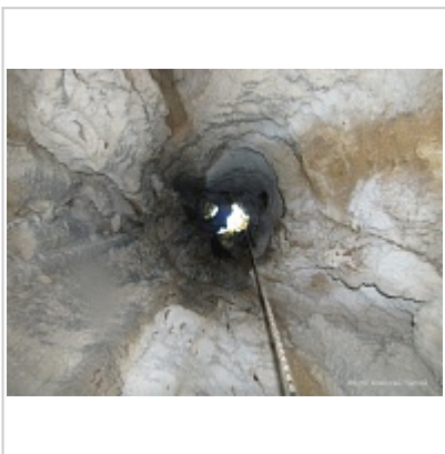
Купол входа 256-7