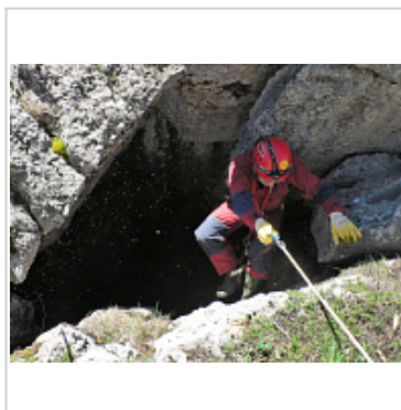
297-4 (Ствол 15)

У входа в колодец 297-4 (Ствол 15)