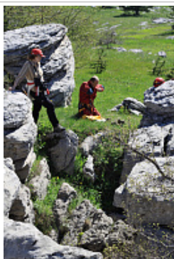
297-4 (Ствол 15)

У входа в колодец 297-4 (Ствол 15)