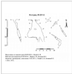
301-1 План и разрез