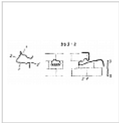
353-2 План и разрезы