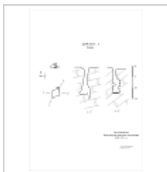
394-1 План, разрез