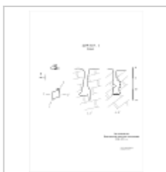
394-1 План, разрез