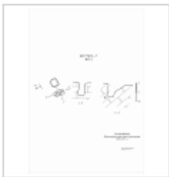
403-2 План, разрез