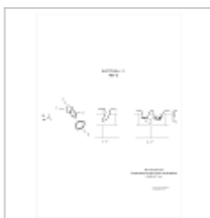
403-6 План, разрез