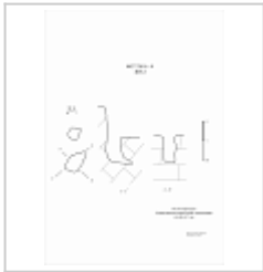
408-2 План, разрез