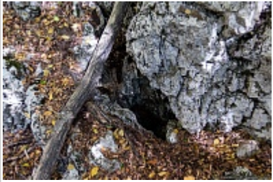
Вход в пещеру