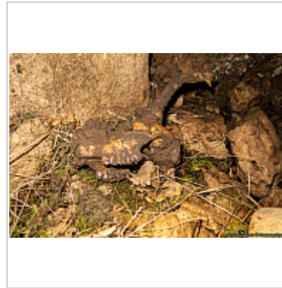
Череп животного на дне колодца