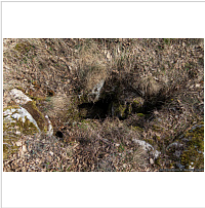
Вход в пещеру 442-16