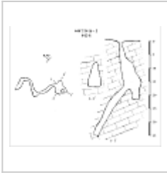
442-8 План, разрез