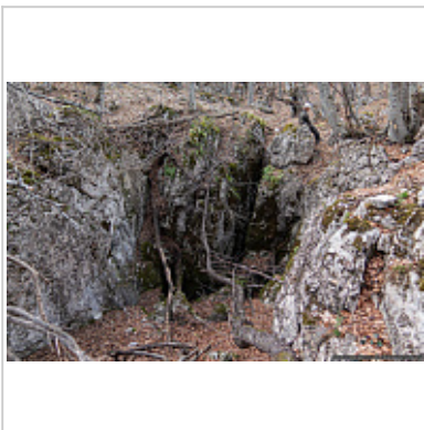
Вход в пещеру