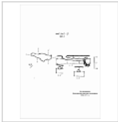
443-1 План, разрез