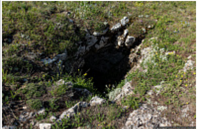
Вход в пещеру