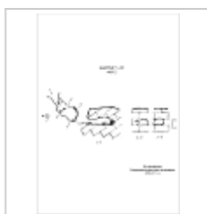
443-2 План, разрез