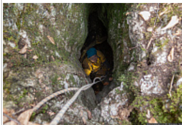
Уступ в пещере Заячья