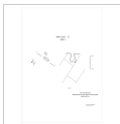
448-1 План, разрез