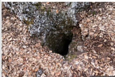
Вход в пещеру Заячья