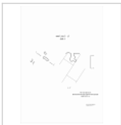
448-1 План, разрез