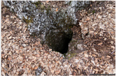
Вход в пещеру Заячья