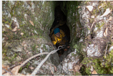
Уступ в пещере Заячья