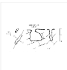
448-17 План, разрез