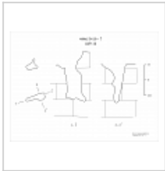
449-14 План, разрез