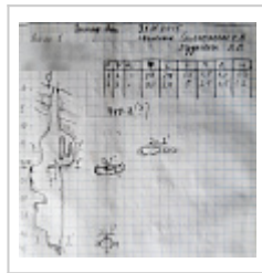
Virс1 (449-7) Разрез