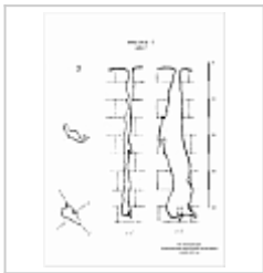
449-7 План, разрез