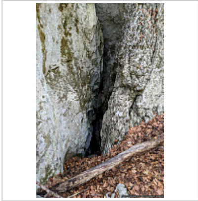
Вход в пещеру