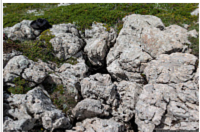
Вход в пещеру