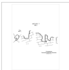
548-1 План, разрез