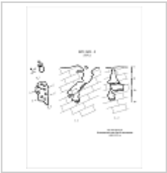
555-2 План, разрез