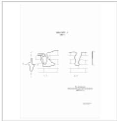
580-1 План, разрез