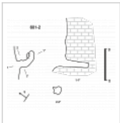
601-2 план и разрез