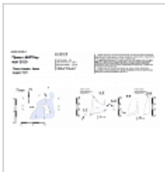
План и разрез Съемка Верченко А.