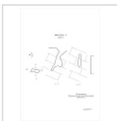
651-1 План, разрез