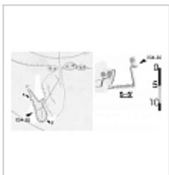
План и разрез Съемка Верченко А.