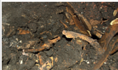
Кости на дне входного колодца