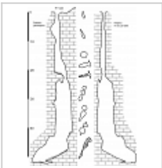
План и разрез Съемка Верченко А., Золотарева Ю. 2004