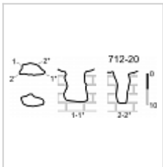
План и разрез Съемка ККЭ