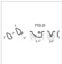
План и разрез Съемка ККЭ