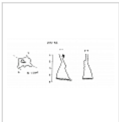
План и разрез Съемка УСА