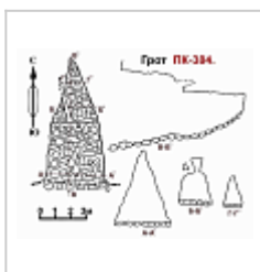
ПК 384 План и разрез