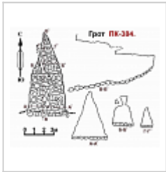
ПК 384 План и разрез