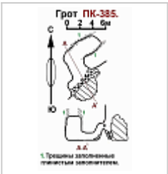
ПК 385 План и разрез